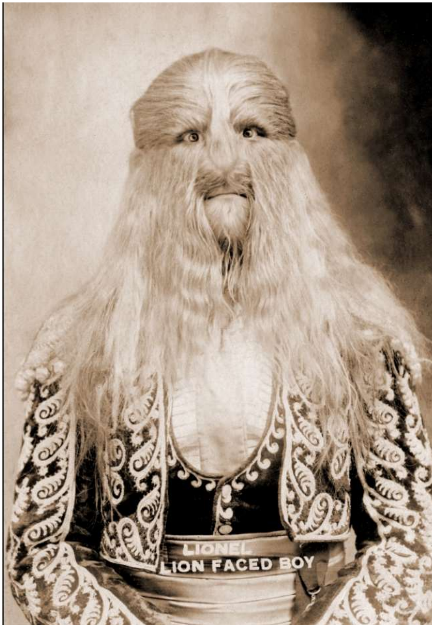
Stéphane Bibrowski – 1905